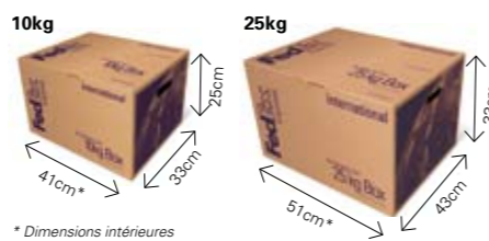
* Dimensions intérieures

Les produits dangereux ne sont pas acceptés dans les emballages FedEx.