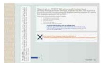
小型醫用包裝袋(背面)

註明或貼有6.2標籤（傳染性物質），而且/或含有乾冰的貨物都不能使用FedEx醫用包裝袋進行包裝。需了解更多關於傳染品運輸與包裝的詳細事宜，請致電FedEx顧客服務部。