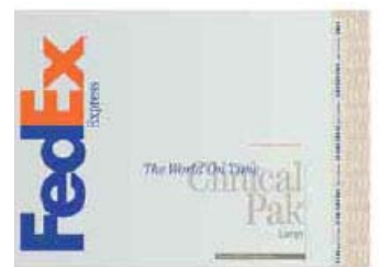
大型醫用包裝袋(正面)

註明或貼有6.2標籤（傳染性物質），而且/或含有乾冰的貨物都不能使用FedEx醫用包裝袋進行包裝。需了解更多關於傳染品運輸與包裝的詳細事宜，請致電FedEx顧客服務部。